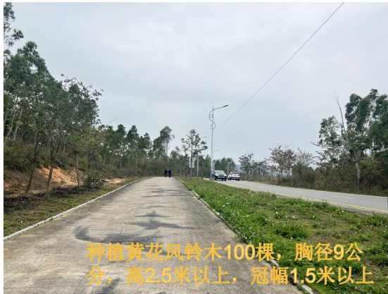
种植黄花风铃木100棵，胸径9公分，高2.5米以上，冠幅1.5米以上