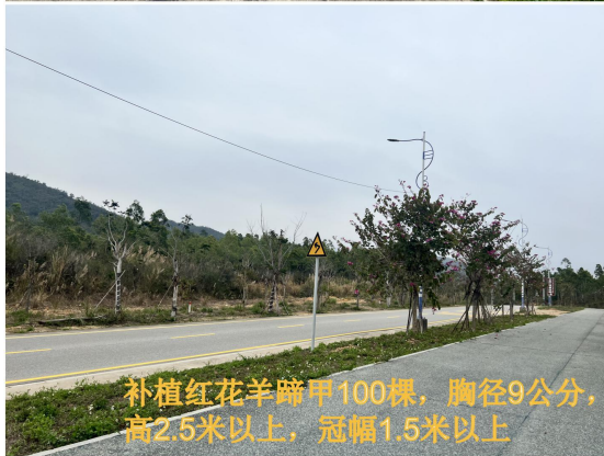
补植红花羊蹄甲100棵，胸径9公分，高2.5米以上，冠幅1.5米以上